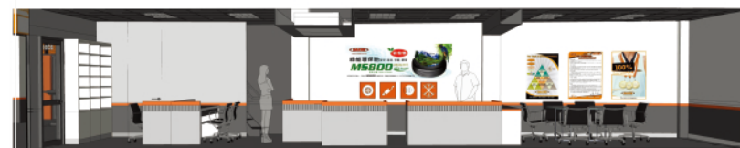
辦公區模擬示意圖