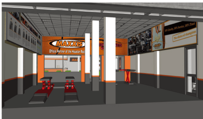
工作區模擬示意圖