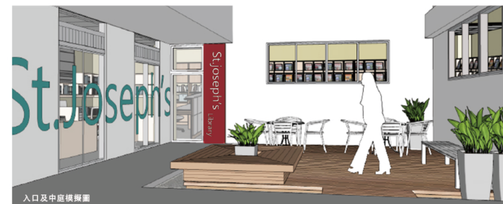
入口及中庭模擬圖