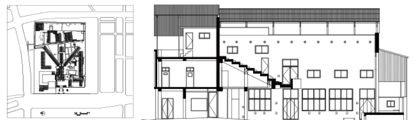
嘉義舊監獄全區配置圖