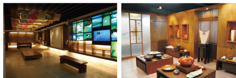
工藝之家展陳空間規劃設計