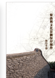
聚落與文化景觀保存操作